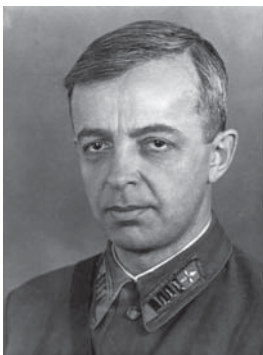
Юлий Григорьевич Томбак