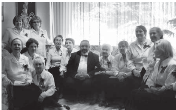
После концерта. Хор Общества старых нижегородцев

пенсию. И вот уже более 25 лет я занимаюсь разного рода общественной деятельностью.