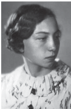
Рика, 1938 г., Москва