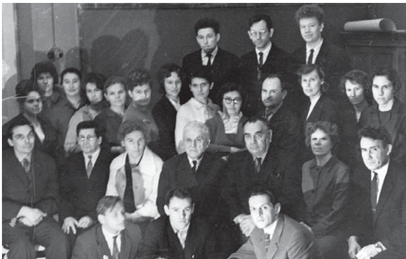
Кафедра кристаллографии, 1966 г.

проигрывал на скрипке чудесные мелодии незнакомых нам песен. Среди учителей были и жены «врагов народа». А в тяжелые годы войны учительский коллектив пополнился эвакуированными из западных областей. Эти люди, пережившие ужасы войны, торопились передать нам все богатство своих знаний. Все свои силы они отдавали школе! Это были наши любимые учителя, трогательная дружба с ними сохранялась долгие-долгие годы.