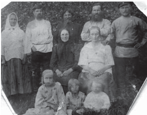
Сидят: мама (справа) и бабушка; стоят: справа – отец, дедушка, прадедушка и старший брат отца с женой; сидят на земле: сестры и брат мамы