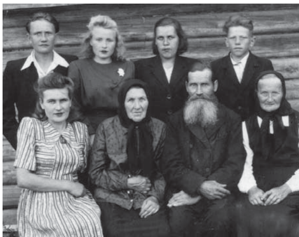
Сидят: мама, бабушка и тетя; стоят: братья и я (вторая слева)

заехал к маме и советовал, чтобы отец срочно исчез куда-нибудь, а то посадят. Мать не поверила, а через 3 дня приехал строитель и сказал, что отца ночью забрали. Взяли 18 августа 1937 года, а 13 сентября расстреляли в Ленинграде. Место захоронения выяснить не удалось.