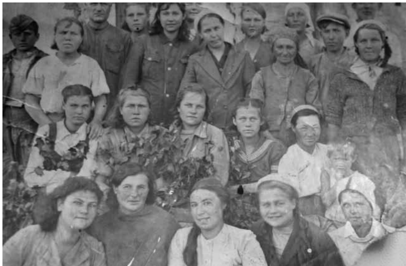
Бригада кирпичного завода ст Балай Красноярского края 1945 год