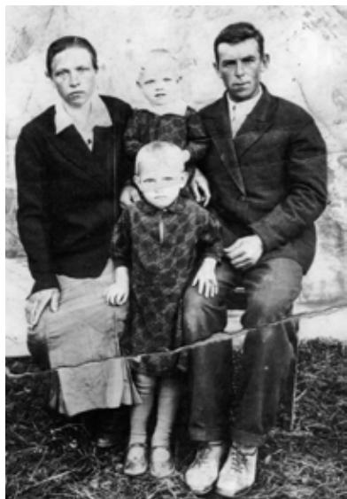
Семья Татко Амурская область поселок Северный 1945 год