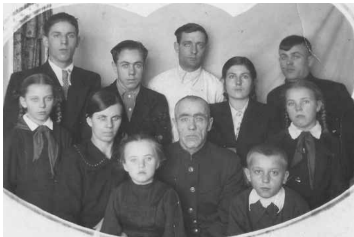
Семья Гельвих Новосибирск 1954 год

нам в дом рисовал портрет нашей родной мамы. Позировал ему старший брат, так как фотографии ее не осталось, а его лицо было – копия маминого (так сказал папа). Мы не понимали немецкую речь, потому что говорили только по-русски. Я так и не выучила немецкий язык, для меня русский был и остается родным языком!