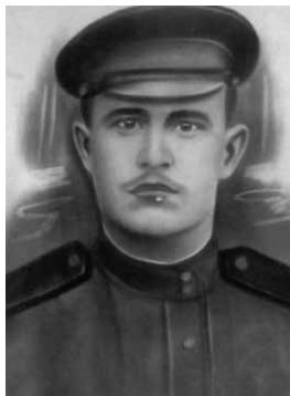
Илья Ефимович Шевчук