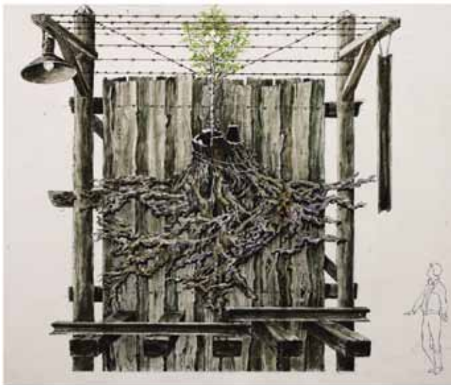
Проект памятника согражданам – жертвам политических репрессий, 2005. Автор: А.Н. Юрков